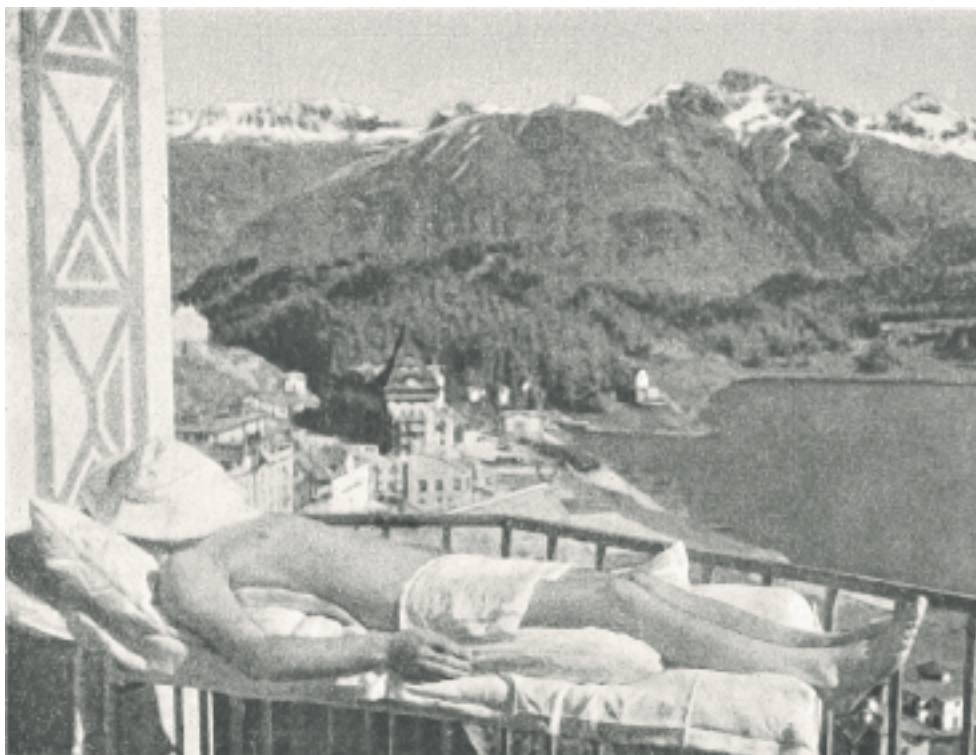
Das spätere Verfahren: Vollsonnenbad auf der Terrasse der Bernhard-Klinik.