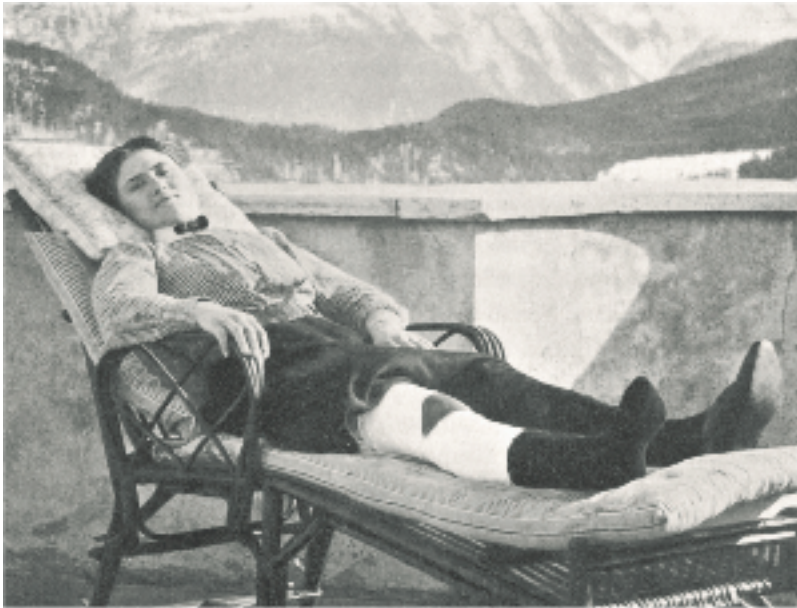
Die anfängliche Methode: Lokale Besonnung durch einen gefensterter Gipsverband.